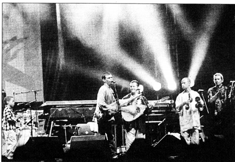
De nombreux groupes de renom doivent offrir une prestation de qualité.